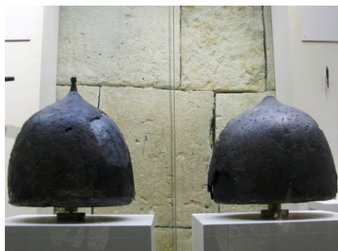
Рис. 1. Шоломи, знайдені в 1976 році під час ремонтних робіт в Арсенальній вежі Московського кремля.

В Польщі та Литві, під шишаками розуміли відкриті шоломи з нерухомим козирком, через який був про-