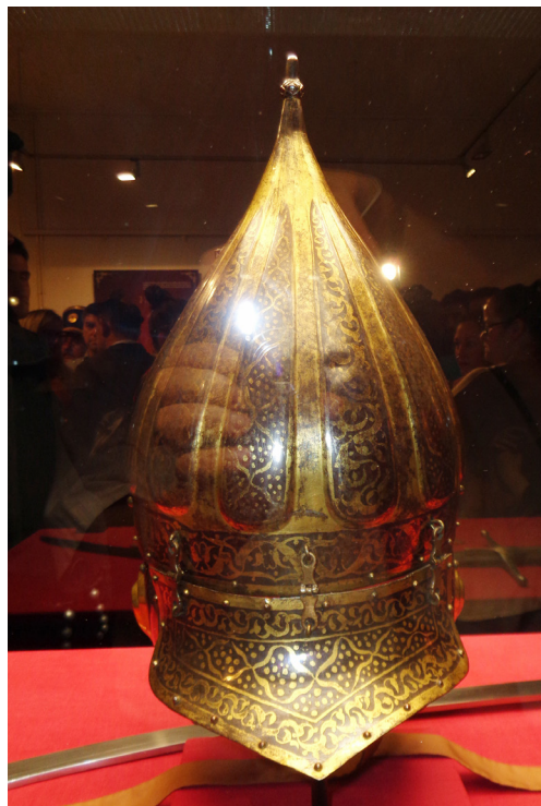
Рис. 7-8. Шишак, що приписують Міклошу Зріні, музей Чаковецького краю. Середина XVI ст.