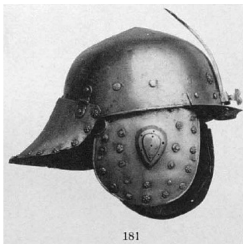
Рис. 4. Шолом №181 із колекції Шереметьєва. Вірогідно знаходиться в Ермітажі. Едуард Ленц, Опись собрания оружия графа С. Д. Шереметьева . (Санкт-Петербург: типография М. Стасюлевича, 1895).