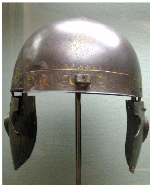
Рис. 2. Шишак царя Михайла Фьодоровича роботи Нікити Давидова, інв. № 4802 (Опис московської Збройної палати 1884 року). Фото знайдене у мережі.