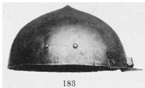
Рис. 3. Шолом №183 із колекції Шереметьєва. Вірогідно знаходиться в Ермітажі. Едуард Ленц, Опись собрания оружия графа С. Д. Шереметьева . (Санкт-Петербург: типография М. Стасюлевича, 1895).

пущений рухомий наносник, що кріпився до лобної частини тулії. У цих шишаків були також додаткові пластинки для захисту щік та потилиці. Форма тулії зустрічалася як напівсферична, так і сфероконічна. В останньому випадку, шишак мав досить виразний наверх 38 . Так шишаками називають шолом з колекції Тишкевичів в Логойську, що зберігається зараз у краківському Вавелі, датований 1550 роком та шолом Миколая Радзівілла Чорного, німецького виробництва, датований 1561 роком (Рис. 6). Такі ж форми зустрічаються у шишаків німецького, угорського та польського виробництва. Наприклад шолом, атрибутований як шишак Міклоша Зріні (Рис. 7). Ймовірно, що таке розмаїття форм шишаків, також могло вплинути на плутанину і в російській термінології шоломів.