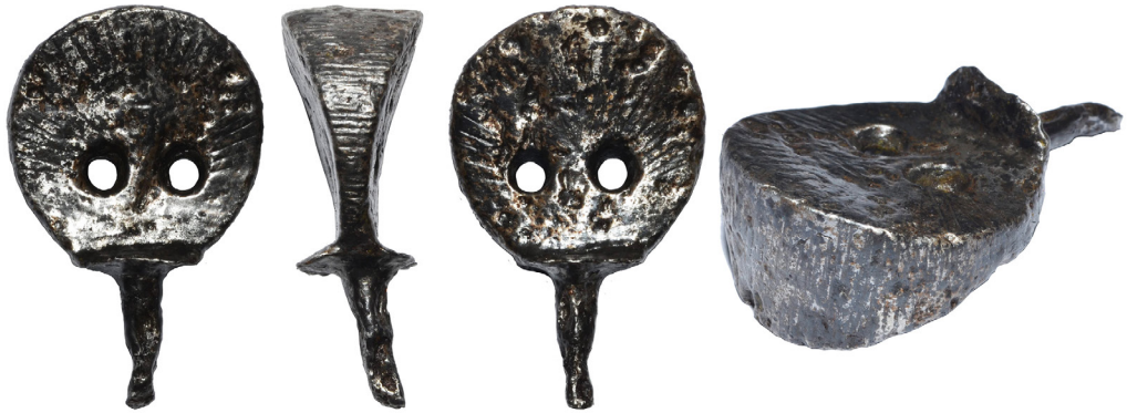
Рис. 5. Нагель IV із приватного зібрання Є. Гредунова.