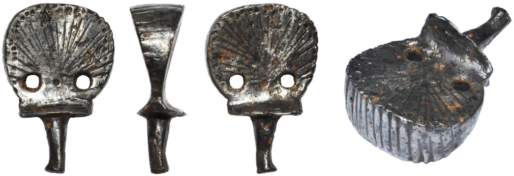
Рис. 6. Нагель V із приватного зібрання Є. Гредунова.

до країв радіально розходяться лінії, а на торці нанесені поперечні лінії. У профіль нагель має широкий (20,5 мм) верх, що поступово симетрично зменшується донизу (до 5,5 мм), а потім розширюється до підпрямокутної основи (19 на 16,5 мм). Стрижень, що фіксується в руків'ї корду має довжину 26 мм, а його діаметер коливається від 7,5 до 4 мм. Загальна висота нагеля – 58 мм, найбільша ширина – 37 мм, діаметр отворів – 5 мм. Вага – 77 г.