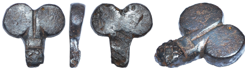
Рис. 7. Нагель VI із зібрання НМІУ, що був віднайдений в Крижопільському районі Вінницької області.