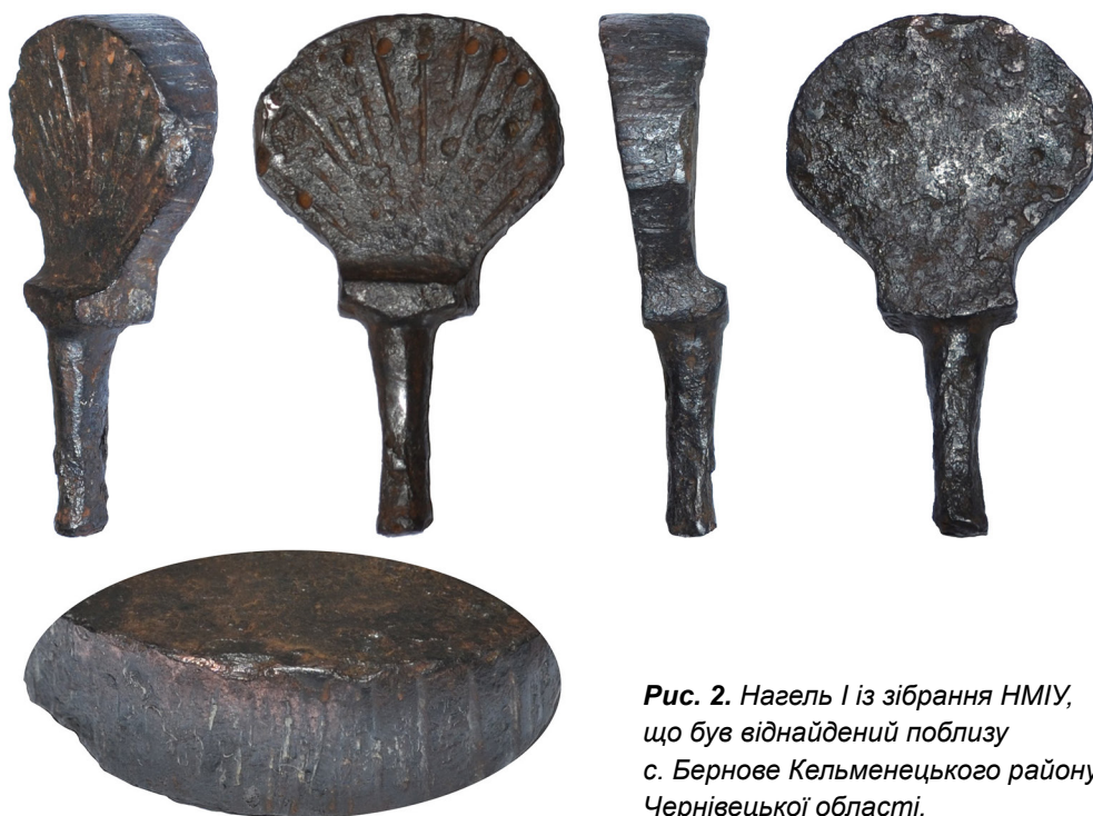
Рис. 2. Нагель I із зібрання НМІУ, що був віднайдений поблизу с. Бернове Кельменецького району Чернівецької області.