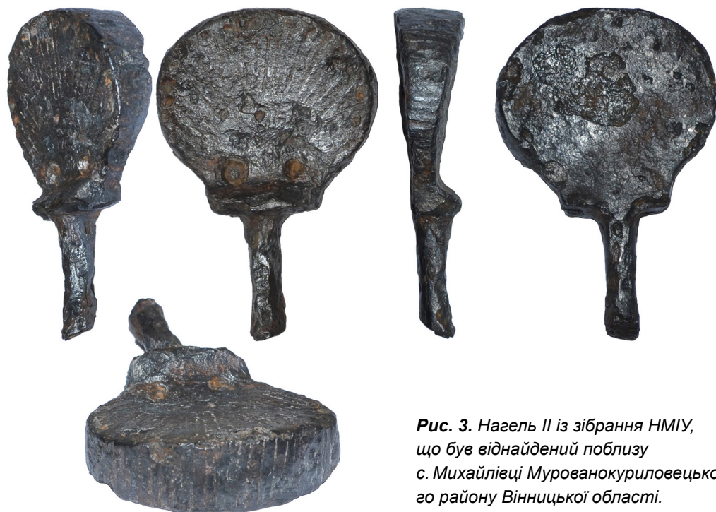
Рис. 3. Нагель II із зібрання НМІУ, що був віднайдений поблизу с. Михайлівці Мурованопуриловецького району Вінницької області.