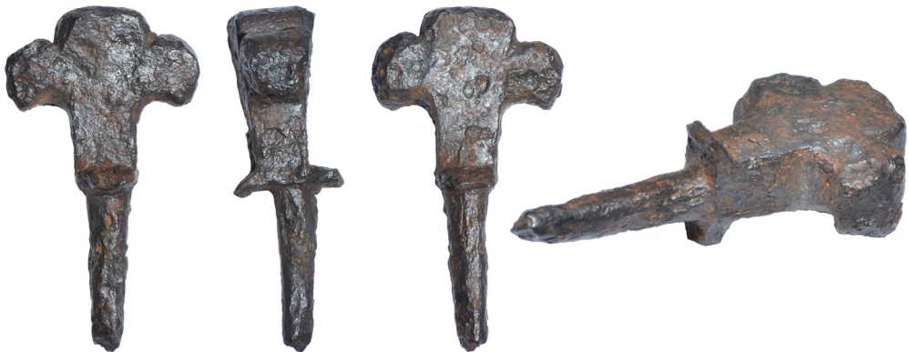
Рис. 10. Нагель IX із зібрання НМІУ, що був віднайдений поблизу с. Величківка Менського району Чернігівської області.