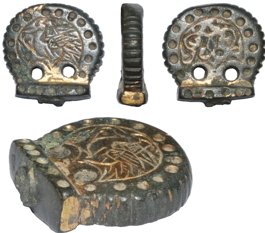
Рис. 4. Нагель III із приватного зібрання Є. Гредунова.

крашений орнаментом та позолотою, від якої залишилися лише окремі фрагменти. Периметр нагелю хвилястий, дещо стертий від використання у верхній частині. На плоских сторонах по периметру розташовані круглі поглиблення, що обрамляють малюнки у центрі. З одного боку можна розрізнити зображення пташки, а от малюнок з іншого боку не вдалося ідентифікувати. Біля основи два наскрізних круглих отвори. Стрижень відсутній. Загальна висота – 21 мм, висота круглого упору – 17 мм, найбільша ширина – 21 мм, а товщина – 4,5 мм, розмір прямокутної основи 16 на 6,5 мм з висотою 3 мм. Вага – 16 г.