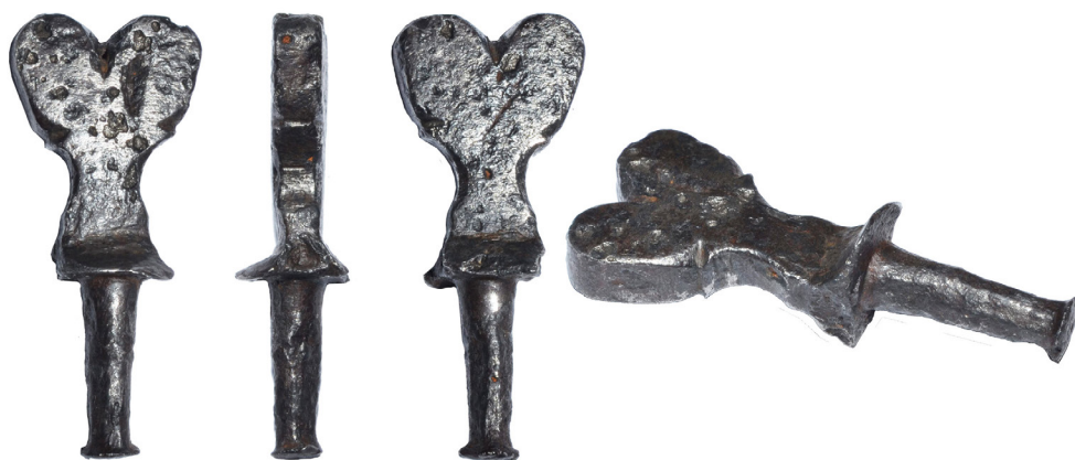
Рис. 8. Нагель VII із приватного зібрання Є. Гредунова.

його діаметер коливається від 7,5 до 5 мм. Загальна висота нагеля – 53 мм, найбільша ширина – 35 мм, діаметр отворів – 4 мм. Вага – 64 г.