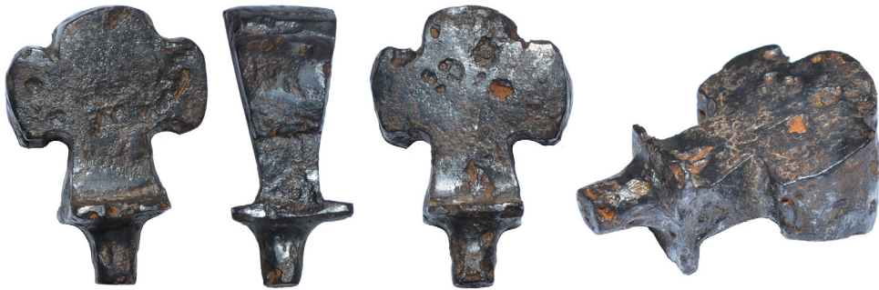
Рис. 9. Нагель VIII із зібрання НМІУ, що був віднайдений в Крижопільському районі Вінницької області.

Нагель IX із зібрання НМІУ (інвентарний номер № ТКВ-19593/5) (Рис. 10) був віднайдений поблизу с. Величківка Менського району Чернігівської об-