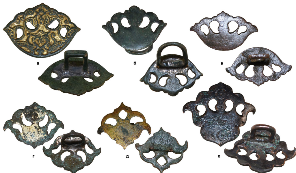
Рис. 6. (а) – Накладка з приватної колекції (знайдена на р. Рів поблизу с. Сербинівці Вінницької обл.); (б) – накладка з приватної колекції (знайдена в Вінницькій обл.); (в) – накладка з приватної колекції (знайдена в Одеській обл.); (г) – накладка з приватної колекції (місце знахідки невідоме); (д) – накладка з приватної колекції (знайдена в Криму); (е) – накладка з приватної колекції (знайдена в Одеській обл.).

або мідного сплаву основи допаювалася петля з відповідного металу. Ззовні гладенькі або з рельєфним орнаментом (часто рослинним орнаментом) їх зазвичай робили з симетричними фігурними отворами, а їх поверхня покривалася позолотою.