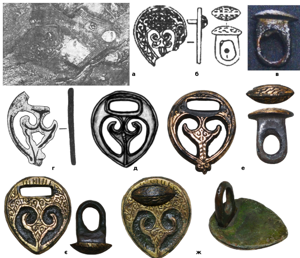
Рис. 1. (а, б) – Залишки шкіряного колчана з накладками для підвісу знайдені в адигському кургані поблизу селища Чегем II в Кабардино-Балкарії (Росія); (в) – «гудзик» із Білгород-Дністровського (Одеська обл.); (г) – фрагмент прорізної накладки з Мангупу (Крим); (д) – прорізна накладка із Білгород-Дністровського (Одеська обл.); (е) – комплект з приватної колекції (знайдений в Світловодському р-ні Кіровоградської обл.); (є) – комплект з приватної колекції (знайдений поблизу с. Цибулеве Кіровоградської обл.); (ж) – загальний вигляд накладки такого типу у зібраному стані.

ми була зроблена при розкопках адигського кургану в Кабардино-Балкарії (Росія) (курган 6, могильник 2 поблизу селища Чегем II) (Рис. 1, а, б) 12 . Колчан був прикрашений позолоченими бронзовими накладками (петля вбула відлита окремо у вигляді «гудзика» з невеликою шляпкою) й склад-