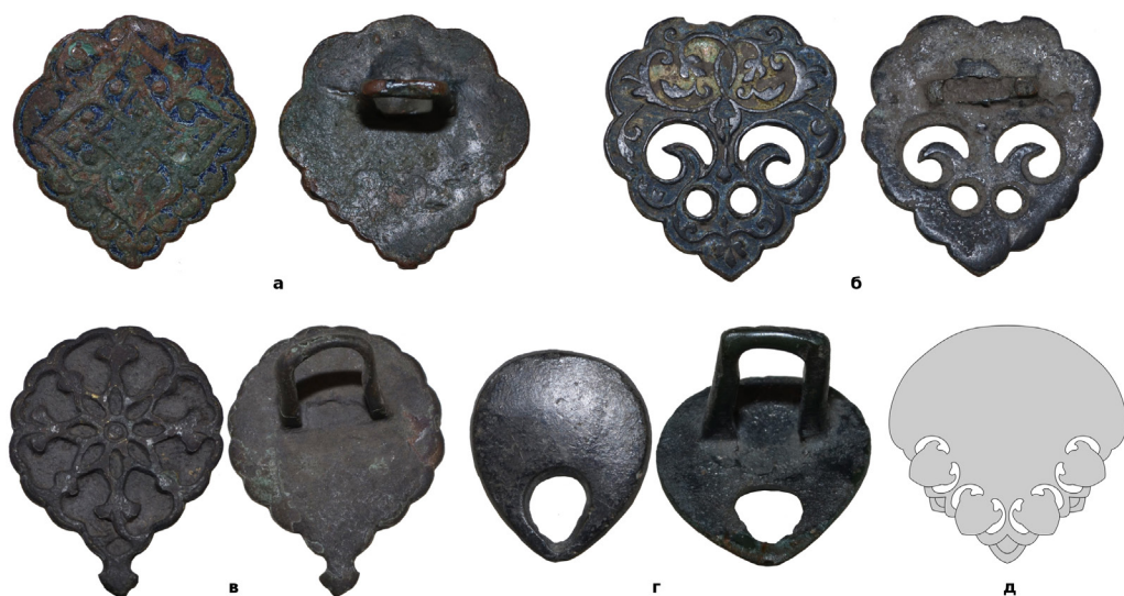
Рис. 3. (а) – Накладка з приватної колекції (знайдена поблизу с. Пекарщина Житомирської обл.); (б) – накладка з приватної колекції (знайдена поблизу с. Лубни Полтавської обл.); (в) – накладка з приватної колекції (знайдена поблизу с. Опішне Полтавської обл.); (г) – накладка з приватної колекції (знайдена в Вінницькій обл.); (д) – промальована накладки з московського колчана 1570-80-х років із зібрання Музею історії мистецтв у Відні.