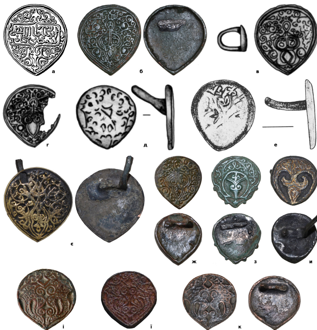
Рис. 2. (а) – Накладка знайдена в Саратовській губернії; (б) – накладка з приватної колекції (знайдена поблизу м. Батурина Чернігівської обл.); (в-д, і) – накладки із Білгород-Дністровського (Одеська обл.); (е) – накладка з Мангупу (Крим); (є) – накладка з приватної колекції (знайдена в Новобузькому р-ні Миколаївської обл.); (ж) – накладка з приватної колекції (знайдена в Херсонській обл.); (з) – накладка з приватної колекції (знайдена в Роменському р-ні Сумської обл.); (и) – накладка з приватної колекції (знайдена поблизу с. Деріївка Кіровоградської обл.); (і) – накладка із Сарайчика (Атирауська обл., Казахстан); (к) – накладка з приватної колекції (знайдена поблизу с. Крупичполе Чернігівської обл.).