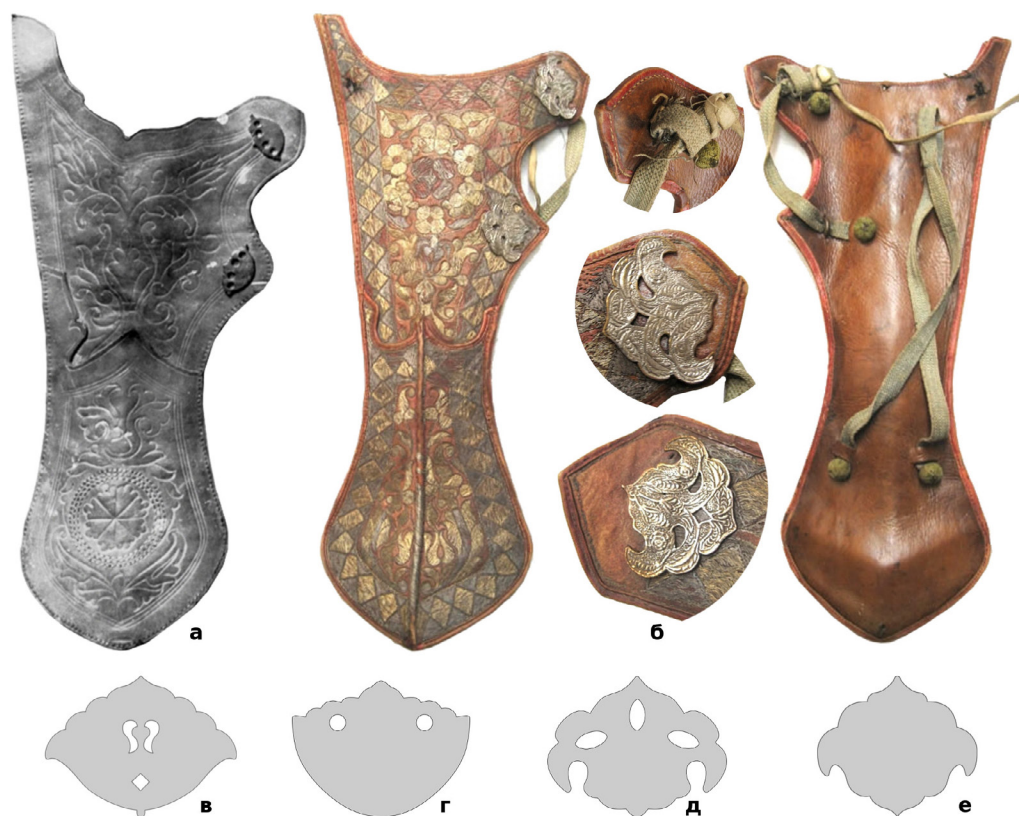
Рис. 7. (а) – Колчан XVII ст. із зібрання Королівської скарбниці в Стокгольмі (© The Royal Armoury, Stockholm); (б) – сагайдак XVII ст. із зібрання Королівської скарбниці в Стокгольмі (© The Royal Armoury, Stockholm); (в) – накладка з московського сагайдака першої половини XVII ст.; (г) – накладка з турецького сагайдаку середини XVI ст.; (д) – накладка з московського сагайдака другої половини XVII ст.; (е) – накладка з турецького налучу XVI ст.

Накладки першої групи широко використовувалися на сагайдаках від XVI до XVIII ст. Зокрема відомі два турецьких сагайдака XVI ст. із зібрання Музею історії мистецтв у Відні (Інв. ном. С1 та С-1а) (Рис. 7, г) 36 та (Інв. ном. У-177) 37 з простими гладенькими накладками. Також гладенькі, без додаткових прикрас, накладки можна побачити на московсько-