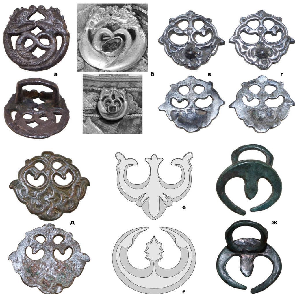
Рис. 5. (а) – Накладка з приватної колекції (знайдена поблизу с. Розівка Одеської обл.); (б) – накладка на татарському сагайдаку початку XVII ст. із зібрання Королівської скарбниці в Стокгольмі; (в) – накладка з приватної колекції (знайдена в Одеській обл.); (г) – накладка з приватної колекції (знайдена в Криму); (д) – накладка з приватної колекції (місце знахідки невідоме); (е) – промальована накладка з турецького колчана XVII ст.; (є) – промальована накладка з татарського колчану початку XVII ст. із зібрання Московського Кремля; (ж) – накладка з приватної колекції (знайдена в Житомирській обл.).