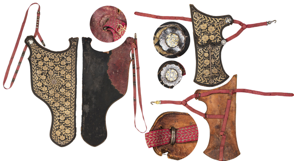
Рис. 9. Сагайдак першої половини XVII ст. із зібрання Королівської скарбниці в Стокгольмі.

з кольорового металу, дехто вважає їх гудзиками, а інші відносять до вузничного або поясного набору. Тут окремо треба зауважити, що деякі накладки теоретично могли б використовуватися і в інших ролях, окрім фіксації елементів сагайдаку. Це цілком можливо при зміні системи кріплення на тильному боці накладки. Але накладки з глибокою й широкою петлею варто вважати в першу чергу елементами саме сагайдачного набору.