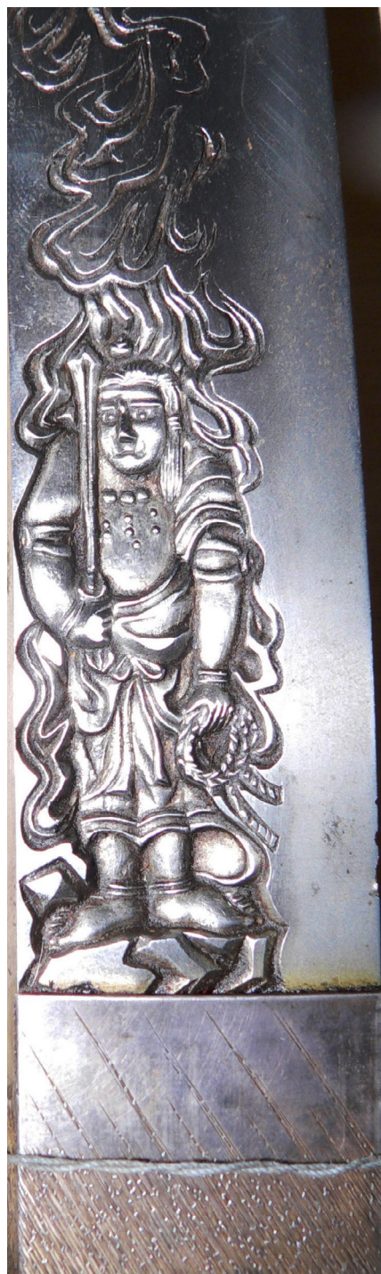
Рис. 13. Вакідзасі: гравіроване зображення (горітопо) Фудо-Мьо-о.

на. Рукоять зі шкіри акули, піхви вкрито чорним лаком. На зворотній стороні піхов вставлено ніжик. На лезі, на правій стороні, глибокої чеканки зображення дракона, що обвився навколо меча. З лівої сторони у техніці глибокого рельєфу зображення воїна надзвичайної чеканки. Чашка гарди, наконечник та інші деталі темного оксидування, прикрашені сріблом – фігурки пташок. Катана виконана при імператорському дворі мікадо. Дуже рідкісний зразок. Дар Антона Казимировича Левковича 54 .