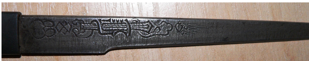
Рис. 19. Вакідзасі: гравірування на клинку ножа когатана.