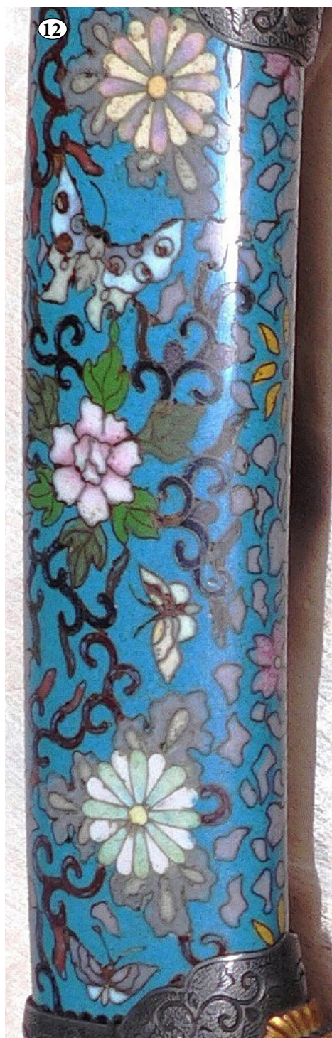
Рис. 10-12. Тачі: Фрагменти декорованих піхов.