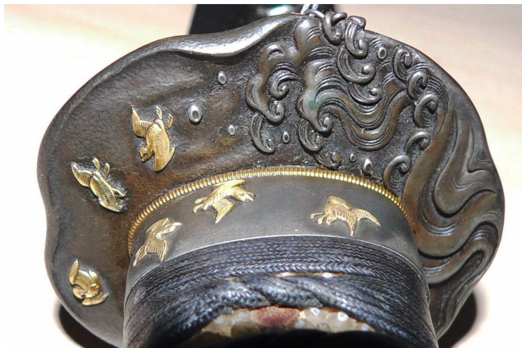
Рис. 15. Вакідзасі: сцена «Птахи над морем» на цубі.

На чільній стороні клинка кодзука гравійовані буддійські символи: 1) «безкінечний вузол» (санскр. shrivatsa ), символ безперервності існуван-