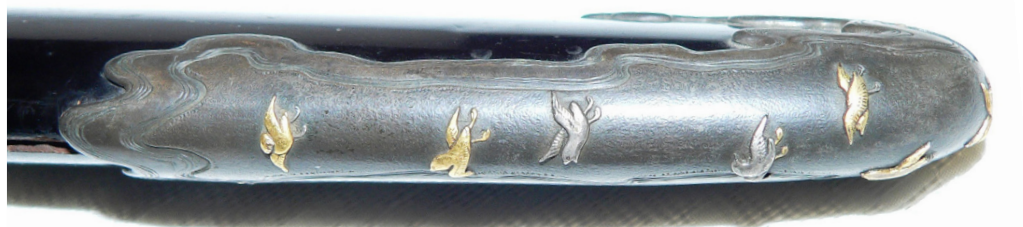
Рис. 17. Вакідзасі: наконечник піхов саядзірі.