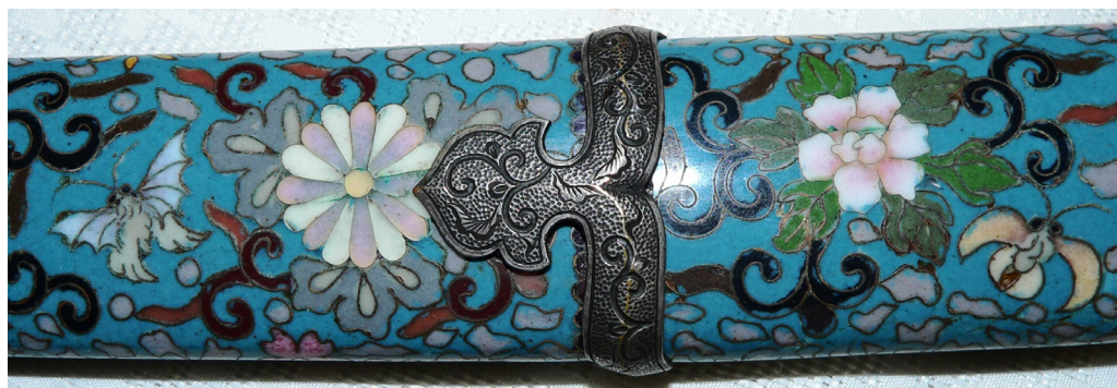
Рис. 4. Тачі: Стягуючі кільця семе-гане.