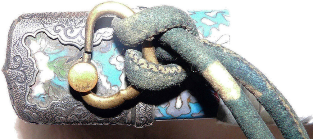
Рис. 9. Тачі: Завершення руків'я – ковпачок кабуто-гане; скоба сару-ме.

перегородками ( jitai-shippo ) та без них ( musen-shippo ), дизайн якого наслідував японські твори XVIII ст. та враховував смаки європейських колекціонерів, зацікавлених в «китайщині» 43 . Одним з центрів емалевого виробництва було с. Тадзіма ( Tojima Village ) нині відоме як Shippo-cho (яп. «Місто перегородчатої емалі»). Продукція Nagoya Cloisonne Company у 1873 р. була відзначена головною нагородою міжнародної Віденської виставки.