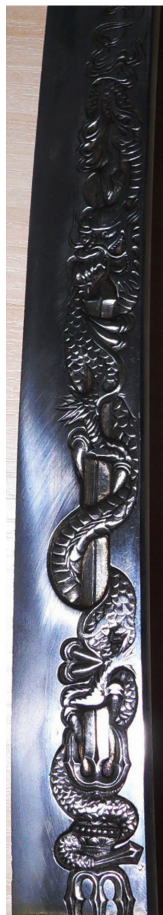
Рис. 14. Вакідзасі: гравіроване зображення ( горітопо ) дракона Курікара Рю-о.

Яскраво декорована цуба є справжньою окрасою виробу – зазвичай цей елемент японського меча щедро оздоблювався згідно смаків замовника та цубако . Обидві сторони цуби вакідзасі з НМІУ декоровані рельєфними кутовими композиціями «Птахи тідорі над морем» (англ. «Chidori (plover) and wave design»; тідорі – морські сивки, птахи з родини куликових з довгими шиєю, дзьобом та хвостом, що зимують на узбережжях морів, річок та озер; вважаються символом зими, напочатку якої тідорі прилітають на Японські острови,