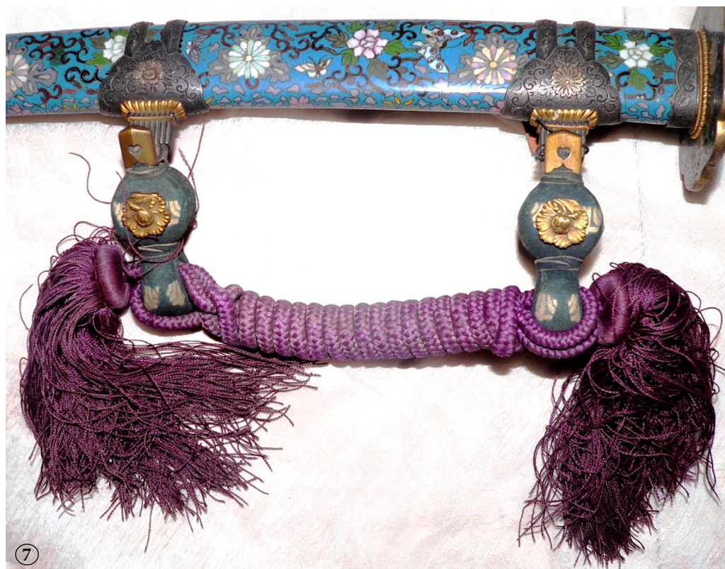
Рис. 6-7. Тачі: Муфти піхов ягура-гане з петлями обіторі зі шнуром саге-о.