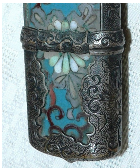
Рис. 2. Тачі: Наконечник піхов саядзірі.

Конструктивними деталями піхов тачі є: 1) наконечник саядзірі (яп. «прикріплений камінь» або «завершення піхов») (Рис. 2); 2) 4 стягуючі кільця семе-гане (яп. «затискаючий метал») з мотивом трилисника (Рис. 4), за фор-