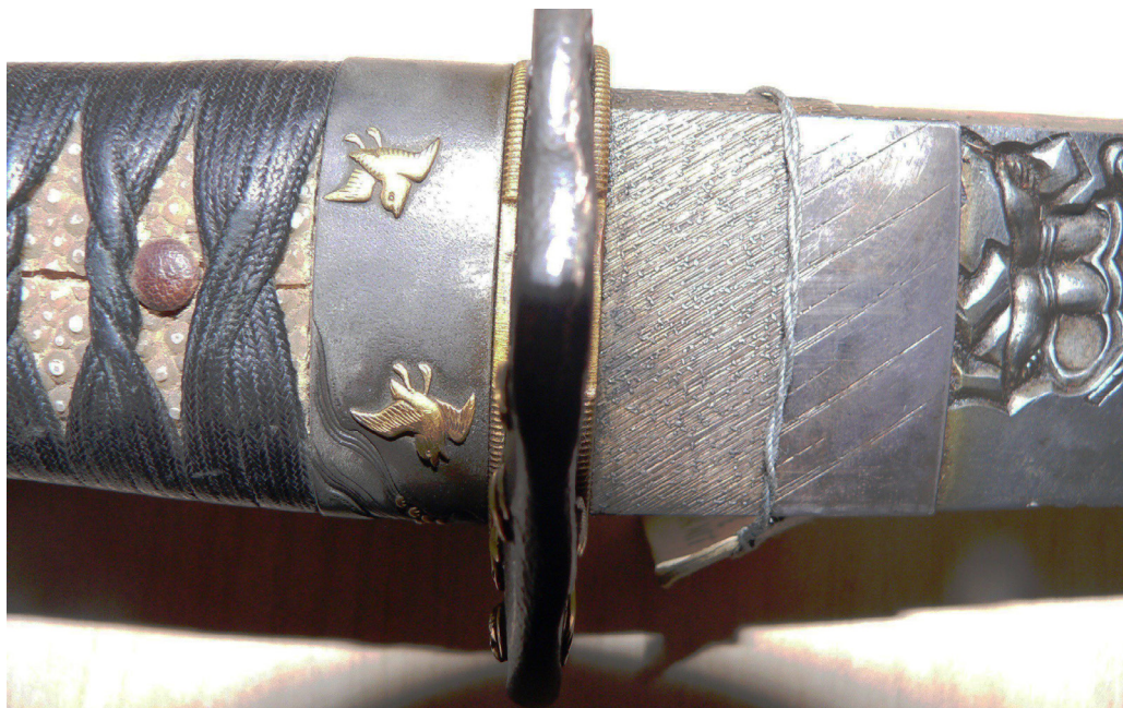
Рис. 16. Вакідзасі: ущільнююча муфта хабакі, штир мекугі та кільце футі-канамоно.