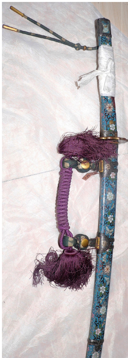
Рис. 1. Тачі: загальний вигляд.

ефу-но-тачі з мінімальною кількістю декору 18 .