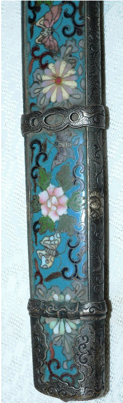
Рис. 5. Тачі: Металеві смуги піхов амаої та сібабікі.

мою подібні до кілець наявних на мечач hyōgo-gusari-no-tachi часів Камакурського сьогунату та сьогунту Муроматі (XII–XVI ст. 24 ).