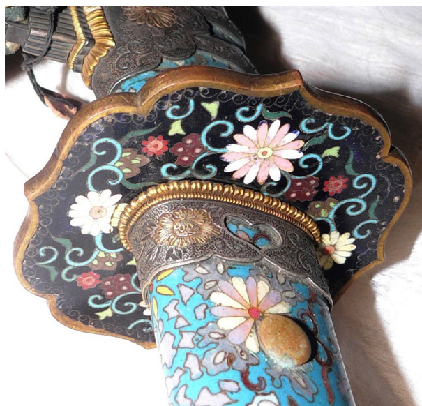
Рис. 8. Тачі: Аоі-гата-цуба; основа руків'я меча цука, оправлена кільцем футі-канамоно; штир мекугі.