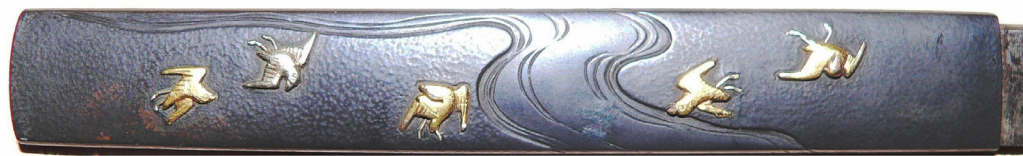
Рис. 18. Вакідзасі: руків'я когатани обасіра.