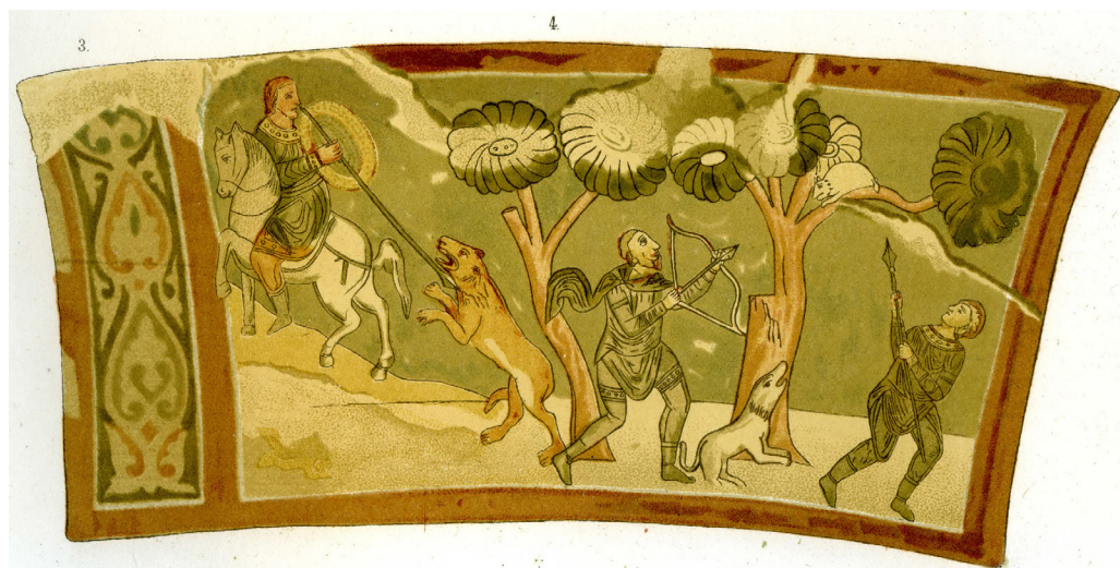
Рис. 7. Полювання на білку та левицю. Фрески південної вежі у замальовці Ф. Солнцева.

зі стрілою бачимо в руках мисливця-лучника, зображеного у символічному медальйоні на склепінні північної «жіночої» вежі.