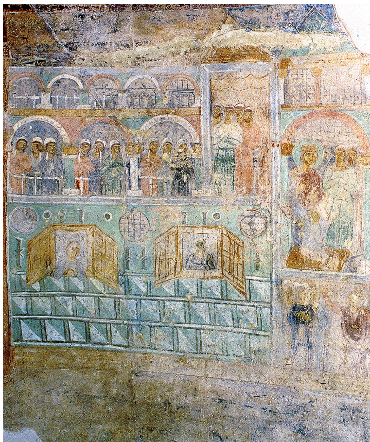
Рис. 2. Палац іподрому. У ложах – візантійська знать, праворуч – Василь II у імператорській ложі та посольство Володимира у ложі послів.