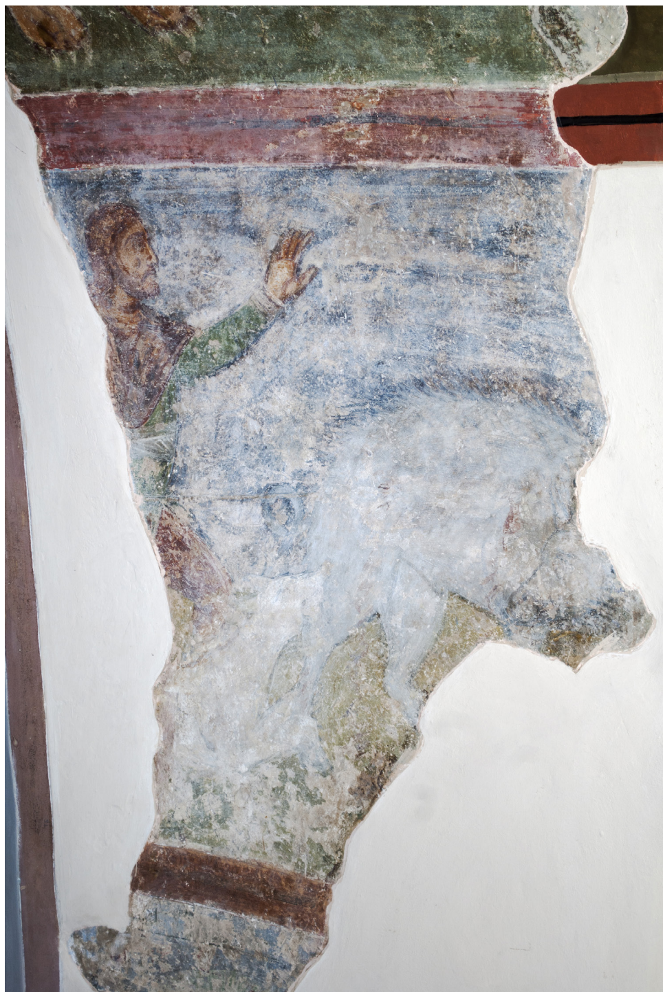
Рис. 6. Полювання на вепра. Фреска південної вежі.