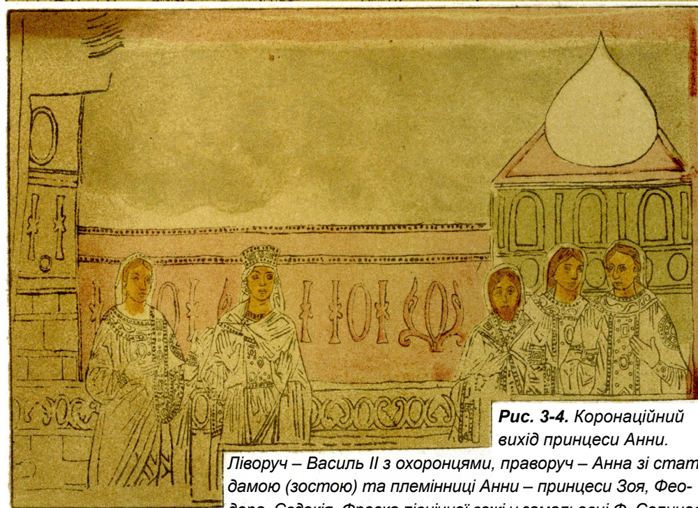
Рис. 3-4. Коронаційний вихід принцеси Анни.

Ліворуч – Василь II з охоронцями, праворуч – Анна зі статс-дамою (зостою) та племінниці Анни – принцеси Зоя, Феодора, Євдокія. Фреска північної вежі у замальовці Ф. Солнцева.