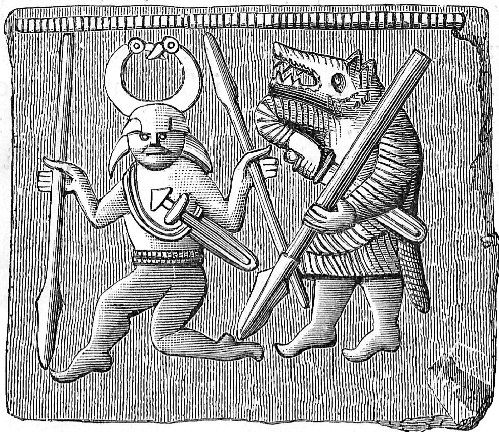
Рис. 9. Двобій берсерків. Пластинка з Торслунда. Прорис.