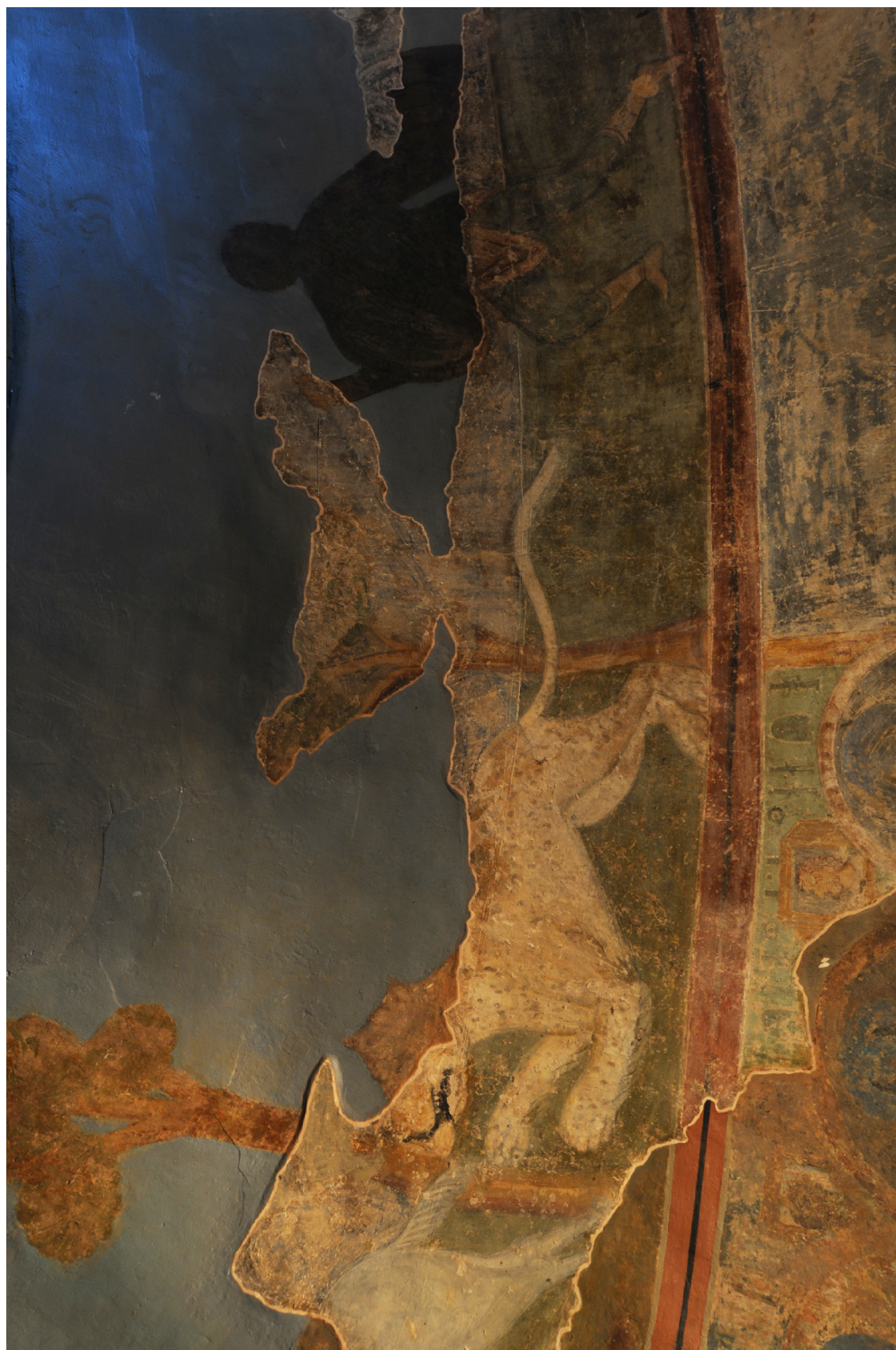
Рис. 5. Полювання з левами і пардусом на тарланів. Фреска південної вежі. Деталь.