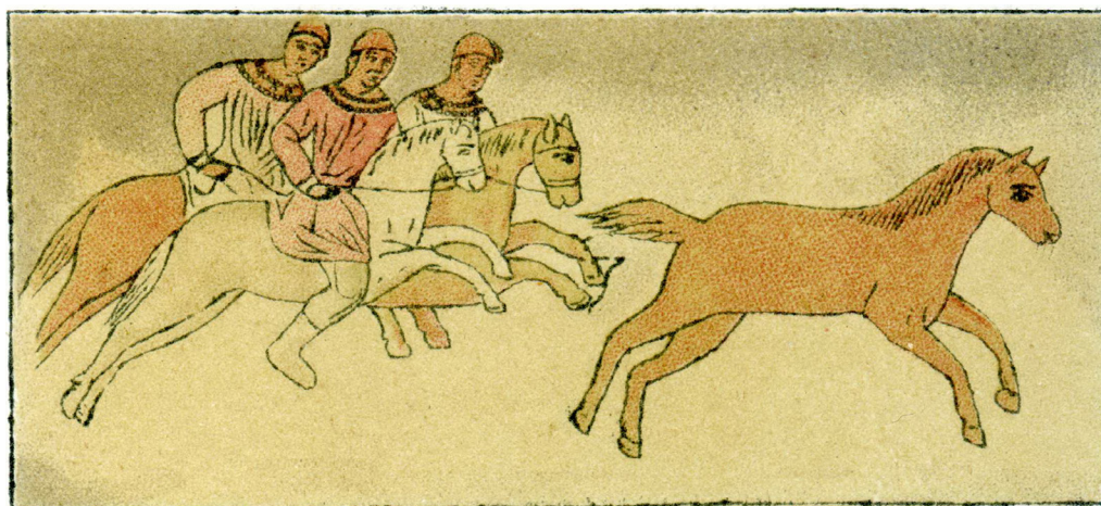
Рис. 8. Полювання вершників на тарпана. Фреска південної вежі у замальовці Ф. Солнцева.

якому належить це спостереження, відзначив, що «Тарпани на стіні Софії (три екземпляри), по-видимому, найдавніші зображення цієї тварини, якщо не рахувати малюнків, виконаних людиною доби Мадлен у печерах південної Франції і північної Іспанії та барельєфів на знаменитій Чортомлицькій вазі» 18 .