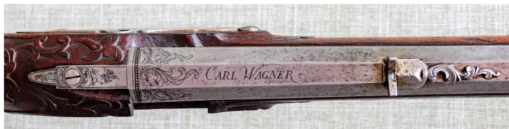
Рис. 8. Підпис майстра К. Х. Вагнера. ПКМВК 3645, 36 361.