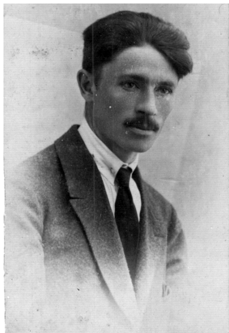
Рис. 3. Валентин Федорович Ніколаєв (1889–1973).