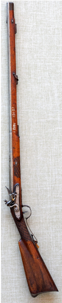
Рис. 5. Рушниця кременна мисливська. Польща. Майстер К. Х. Вагнер. Друга половина XVIII ст. ПКМВК 3662, 36 378.

вою зброєю. Бойову зброю у власних садибах зберігали учасники військових подій: вона прикрашала стіни віталень, нагадуючи про подвиги предків і господарів 13 .