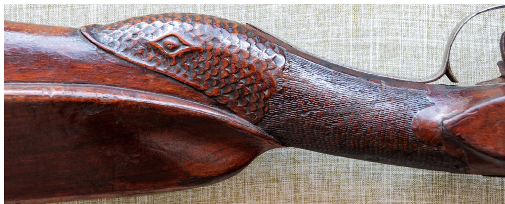
Рис. 14. Шийка штуцера майстра Михайлова. ПКМВК 3652, 36 368.