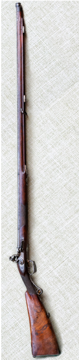
Рис. 9. Рушниця кременна мисливська. Австро-Угорщина. Майстер Йох(им) Пекер. 1772 р. – перша половина XIX ст. ПКМВК 3375, 36 111.

До цікавих зразків кременної вогнепальної мисливської зброї відносяться рушниці за інвентарними номерами Зб 111, Зб 112, Зб 368. Усі вони також належать до довоєнної зброярської колекції, адже відомості про них знаходимо у інвентарних книгах №№ 11 24 та 19 Полтавського державного музею 1939 р. 25 та списку зброї, реєвакуйованої з Уфи (Росія) 26 .