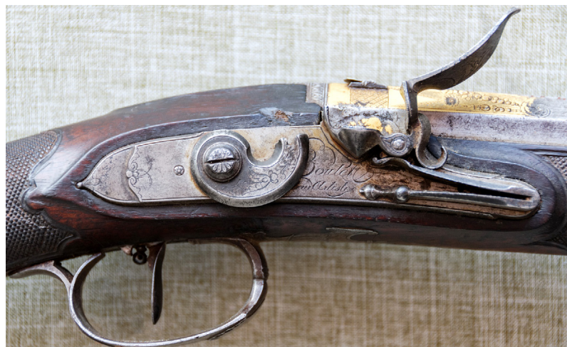
Рис. 12. Підпис майстра Н.-Н. Буте. ПКМВК 3376, 36 112.

дерев'яний. Дерев'яні частини рушниці лаковані. Прибор сталевий. Спускова скоба орнаментована мотивом «ріг достатку», з фігурним завитком. Передній кінець скоби має вигляд корони, задній – вазону.