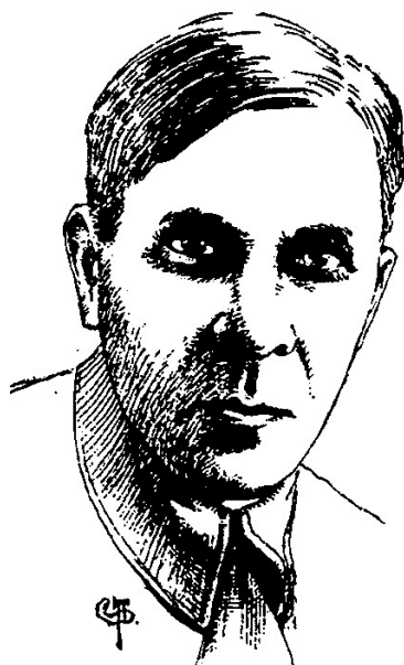
Рис. 2. Михайло Якович Рудинський (1887–1958). Художник Є. Путьря.