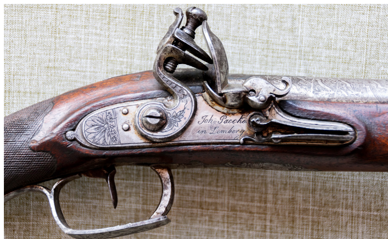
Рис. 10. Підпис майстра Й. Пекера. ПКМВК 3375, 36 111.

Дослідження цієї рушниці дозволяє не лише атрибутувати чудовий зразок кременної вогнепальної мисливської зброї другої половини XVIII ст. – початку XIX ст., а і прослідкувати одну із сторінок історії становлення українського зброярства. Для цього звернемо увагу на написи, залишені майстром на окремих деталях виробу. Висновок: перед нами зразок рушниці львівського виробництва. Відомо, що місто Львів у 1772 р. увійшло до складу Австрійської (згодом Австро-Угорської) імперії і до 1918 р. носило офіційну назву Лемберг. Місто славилось розвитком ремісничого виробництва, різноманітністю ремісничих цехів. Так, цех рушничників ( bombardarii ) працював тут ще з 1637 р., періодично об'єднуючись разом з цехами токарів, слюсарів, шліфувальників. Австрійська влада в цілому сприяла розвитку цехового виробництва, але вже на початку XIX ст. законодавчо дозволила окремим майстрам працювати і поза цехами, створюючи умови для вільної конкуренції. Щодо українців, особливо православного віросповідання, в окремих львівських ремісничих цехах для них існувало повне недопущення до професії. Наприклад, вони не мали права вступати до цеху рушничників і навіть навчатися у майстрів, бо це каралося значним штрафом. Для цехового устрою Львова (Лемберга) XVIII ст. була притаманна організація так званих «національних цехів» вірменами та євреями. У 1767 р. єврейські ремісники створили окремий зброярський цех 27 . Цехові документи збереглись до наших днів у невеликій кількості і, на жаль, встановити належність