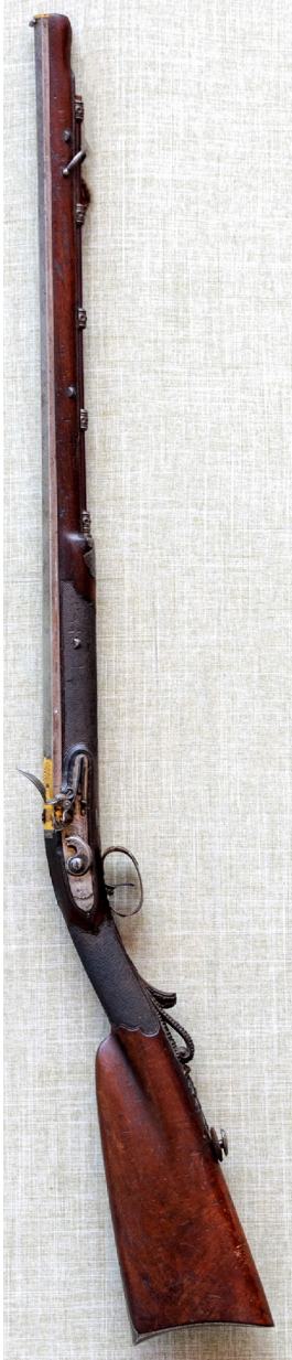
Рис. 11. Рушниця (штуцер) кремінна мисливська. Франція. Майстер Ніколя-Ноель Буте. 1799–1802 рр. ПКМВК 3376, 36 112.