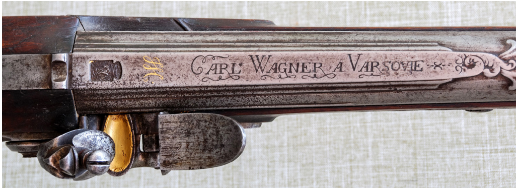
Рис. 6. Підписи майстра К. Х. Вагнера. ПКМВК 3662, 36 378.

«WARSOVIE», а отже, обидва зразки були виготовлені відомим німецьким зброярем Карлом Христіаном Вагнером (роки життя невідомі), родом з м. Дрезден, що у 1754–1764 рр. працював майстром при дворі польського короля Августа III Фрідріха у Варшаві 16 . Рушниці майстра Карла Вагнера – яскравий зразок кустарного зброярського виробництва XVIII ст., коли фірмове виробництво зброї ще не набуло поширення. Кожен екземпляр виготовлявся індивідуально і мав надзвичайно високу якість, а, відповідно, і вартість.